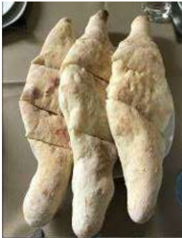
- คาซาปური ขนมปังหน้าชีสเยิ้มๆ