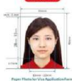
Photo for Visa Application Form