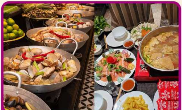
พิเศษ !!! บุฟเฟ่ต์นานาชาติ SEN BUFFET และ เมนูชาบูหม้อไฟลาแซลมอน+ไวน์แดงดาด