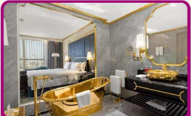
พิก Golden Lake 5 ดาว 1 คืน