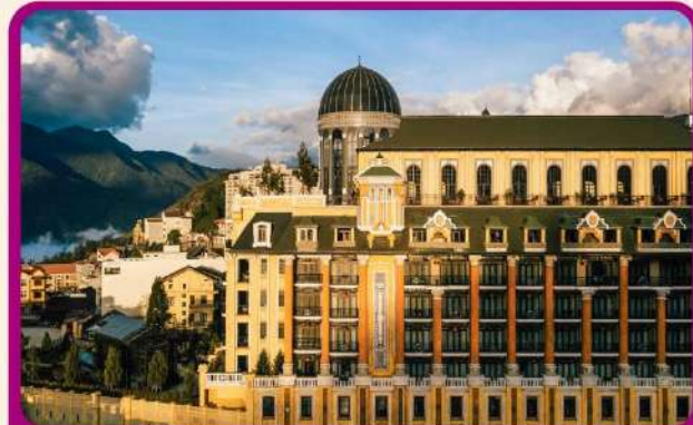
พิก Mgallery Sapa 5 ดาว 2 คืน