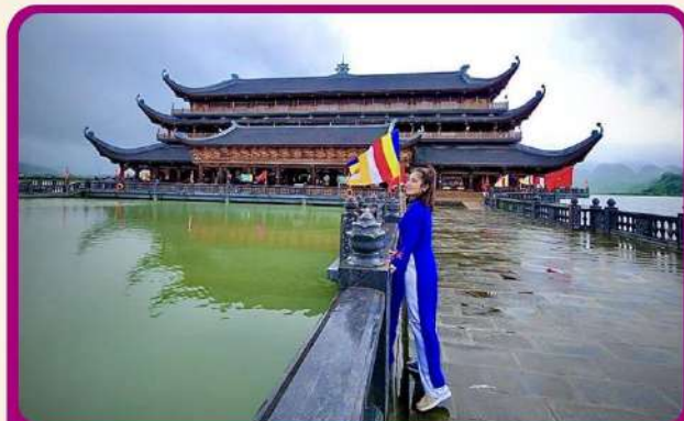
จุดเช็คอินแห่งใหม่ “วัดตามจุก”