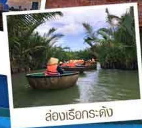
ล่องเรือกระดิง