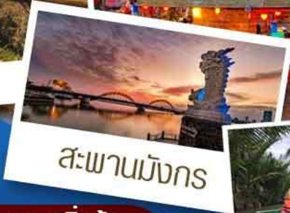
สะพานมังกร