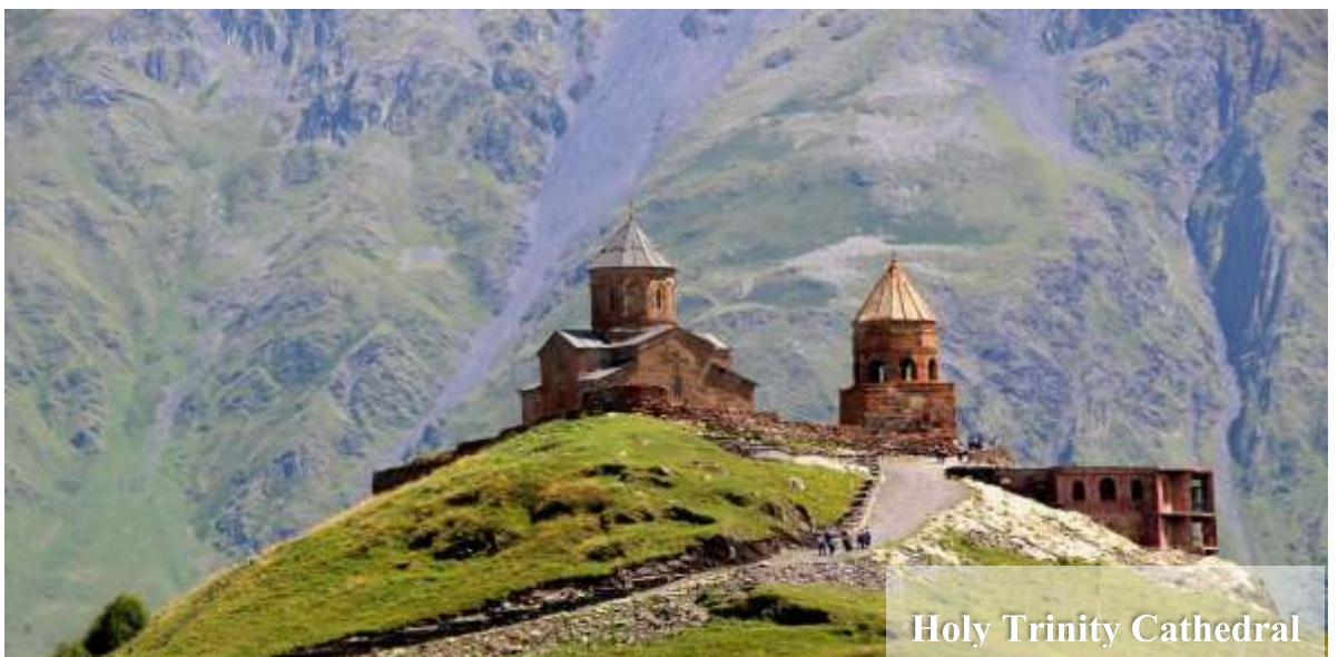
Holy Trinity Cathedral

จากนั้นนำท่านขึ้นรถ 4WD (รถขับเคลื่อน 4 ล้อ) เพื่อเข้าสู่ใจกลางหุบเขาคอเคซัส (Caucasus) นำท่านไปชมความสวยงามของ โบสถ์เกอร์เกตี (Gergeti Trinity Church) ซึ่งถูกสร้างขึ้นในราวศตวรรษที่ 14 มีอีกชื่อเรียกกันว่า ทสมินดา ซามีบา (Tsminda Sameba) ชื่อที่เรียกที่นิยมกันของโบสถ์ศักดิ์แห่งนี้สถานที่แห่งนี้ตั้งอยู่ริมฝั่งขวาของ แม่น้ำซคเฮรี อยู่บนเทือก