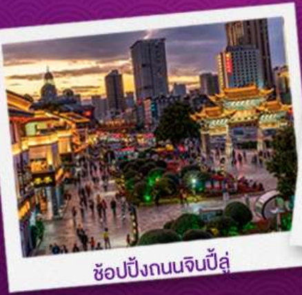
ช้อปปิ้งถนนจินปี้ลู่