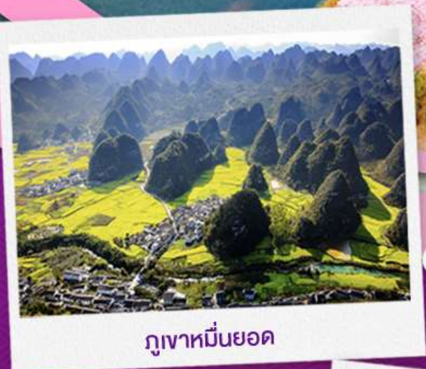
ภูเขาเทียนยอด