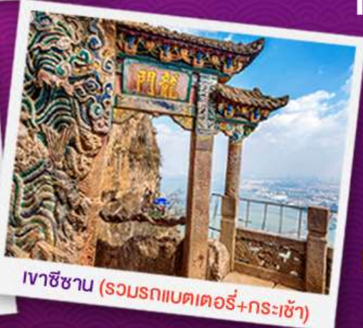
เวาซีซาน (รวมรถกอล์ฟ+กระเช้า)