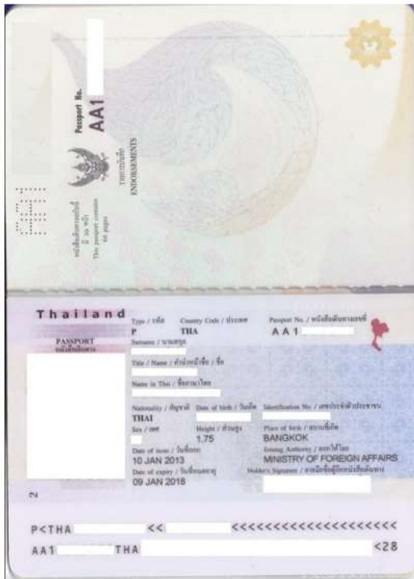
วางรูปถ่ายข้างๆPassport แล้ว สแกนพร้อมกัน

(ราคาใหม่ปรับใช้ตั้งแต่ 15 มีนาคม 62 เป็นต้นไป ประกาศจากสถานทูตจีน)