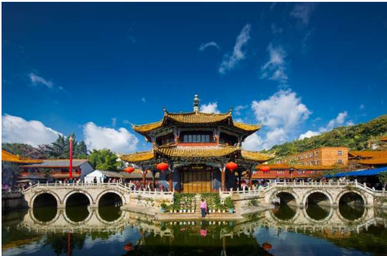
ไทยให้อัญเชิญไปประดิษฐานไว้ ณ ที่วัดหยวนทงแห่งนี้

กลางลานมีสระน้ำขนาดใหญ่ มีสะพานข้ามไปสู่ศาลาแปดเหลี่ยมกลางสระด้านหลังวัดเป็นอาคารสร้างใหม่ ประดิษฐานพระพุทธรูปพระพุทธรชินราช(จำลอง)ซึ่งพลเอกเกรียงศักดิ์ ชมะนันทน์นายกรัฐมนตรีคนที่ 15 ของ