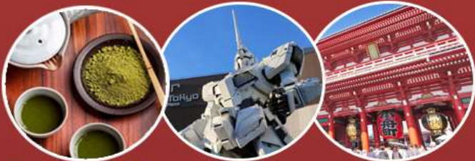
เรียนชงชาแบบญี่ปุ่น Unicorn Gundam Asakusa Temple