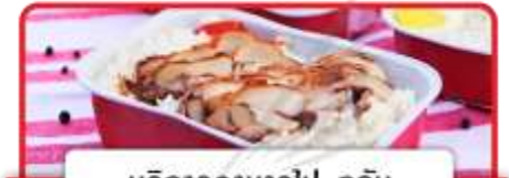
บริการอาหารไป-กลับ