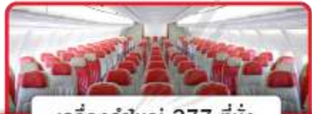
เครื่องบินใหญ่ 377 ที่นั่ง