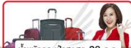
น้ำหนักกระเป๋าสูงสุด 20 กก.