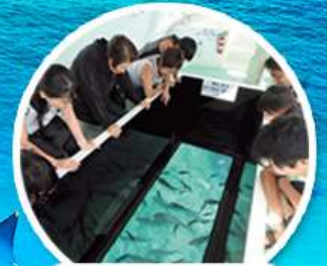
ล่องเรือกระจก