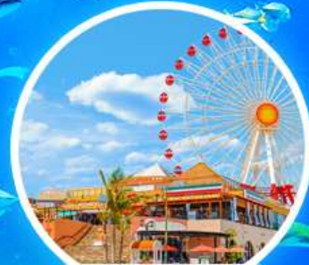
หมู่บ้านอเมริกัน

เดินทางโดยสายการบิน PEACH AIR บินตรงสู่เกาะโอกินาวา พิเศษ!!!! บุฟเฟต์ปิ้งย่างเทป็นยากิแบบไม่อัน เมนูซาซุ พร้อมโชว์แล่ปลากุนา