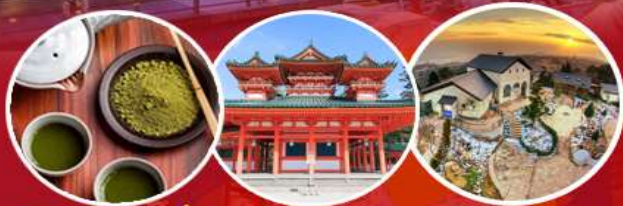
เรียนชงชาแบบญี่ปุ่น