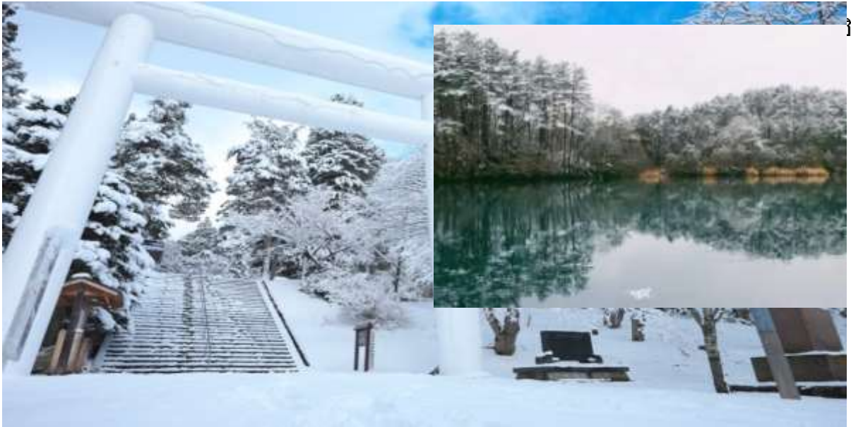
ิงภูเขาบัน

นำท่าน และสักการะสิ่งศักดิ์สิทธิ์ของ ศาลเจ้าซานิทสึ ศาลเจ้าแห่งนี้ได้จดทะเบียนเป็นมรดกโลกขององค์การยูเนสโก ก่อนถูกเผา และภายหลังได้รับการบูรณะซ่อมแซม ปัจจุบันเป็นอีกหนึ่งสถานที่ ที่มีชื่อเสียงในด้านความสวยงาม และการเพลิดเพลินกับการชมใบไม้เปลี่ยนสีในช่วงฤดูใบไม้ร่วง หากเป็นช่วงฤดูหนาวก็จะมี ความสวยงามที่แปลกตาไปอีกบรรยากาศ