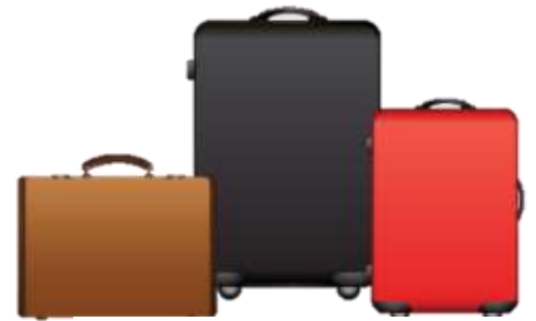
น้ำหนักกระเป๋า 20 กิโลกรัมต่อ

*** ในการเดินทางเป็นหมู่คณะ การจัดที่นั่งของกรุ๊ป ไม่สามารถรีเคสหรือเลือกที่นั่งได้ และทางสายการบินเป็นผู้กำหนด ซึ่งทางบริษัทฯ ไม่สามารถเข้าไปแทรกแซงได้ ***