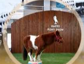
ชมความน่ารักของม้า Northern Hourse Park