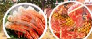
พิเศษ!!! บุฟเฟ่ต์ชาบูยักษ์ 3 ชนิด + บุฟเฟ่ต์ยากินิคู และอาบน้ำแร่แช่ออนเซน