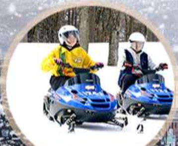
แถมฟรี!!! Snow Mobile