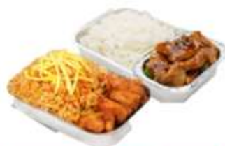
บริการอาหารร้อน ไป-กลับ บนเครื่อง

** เนื่องจากเป็นตั๋วกรุ๊ป จึงไม่สามารถปรับราคาอาหารได้ **