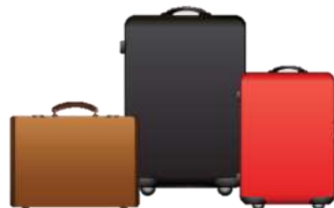
น้ำหนักกระเป๋า 20 กิโลกรัมต่อ

** เนื่องจากเป็นตั๋วกรุ๊ป จึงไม่สามารถปรับราคาอาหารได้ **