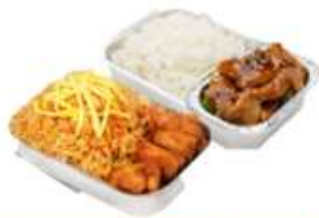
บริการอาหารร้อน ไป-กลับ บนเครื่อง

** เนื่องจากเป็นกรุ๊ป จึงไม่สามารถตรวจสอบอาหารได้ **