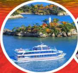
ชมอ่าวมัตสึชิม่า