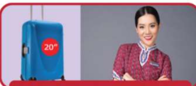
น้ำหนักกระเป๋าสูงสุด 20 กก.

** ไม่มีบริการอาหารและเครื่องดื่มบนเครื่องบิน แต่มีจำหน่าย ใช้น้ำดื่มโดยประมาณ 6 ชั่วโมง **