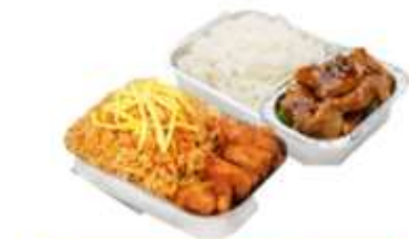
บริการอาหารร้อน ไป-กลับ บนเครื่อง ** เนื่องจากเป็นตั๋วเครื่องบิน จึงไม่สามารถยกน้ำหนักกระเป๋าได้ **