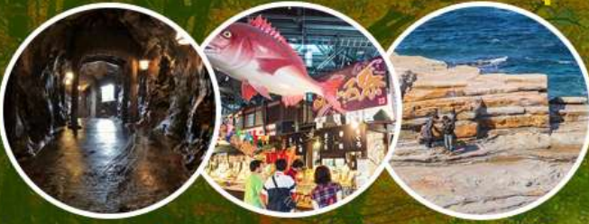
Sandanbeki Cave ตลาดปลาโรชิโอะ โขดหินเซนโจจิกิ