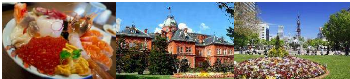
พักที่ THE B SAPPORO SUSUKINO หรือเทียบเท่า