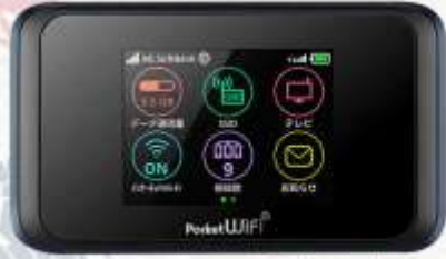
POCKET WIFI สำหรับนำไปใช้ที่ประเทศญี่ปุ่น