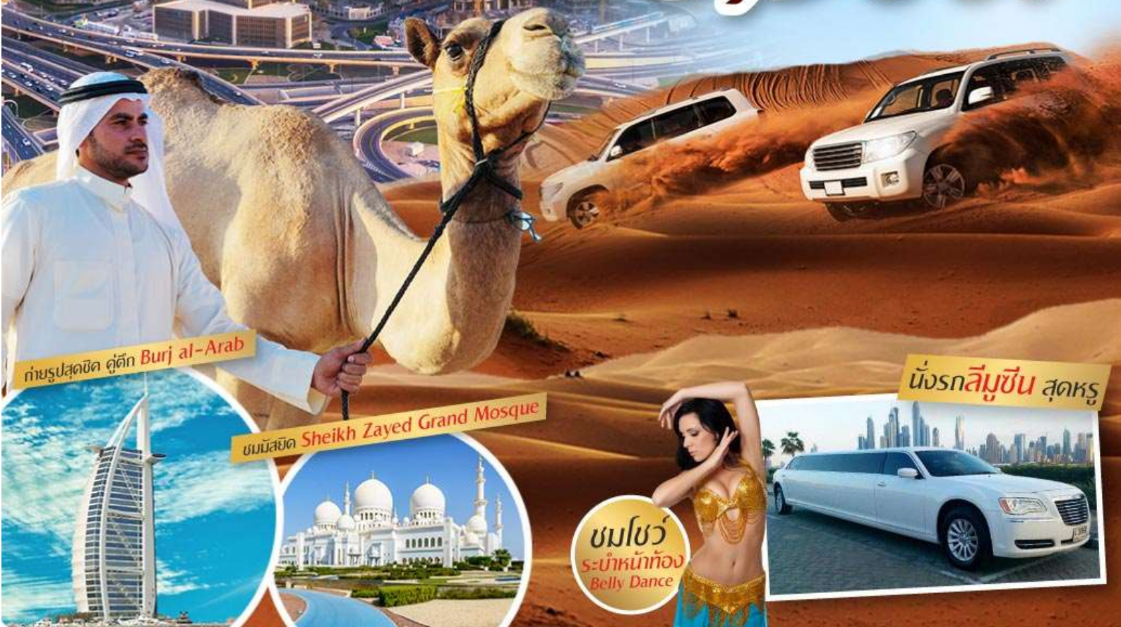
ถ่ายรูปสุดฮิต ตูตึก Burj al-Arab