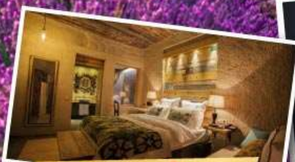
พักโรงแรมดี 1 คืน