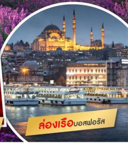
ล่องเรือบอสฟอรัส