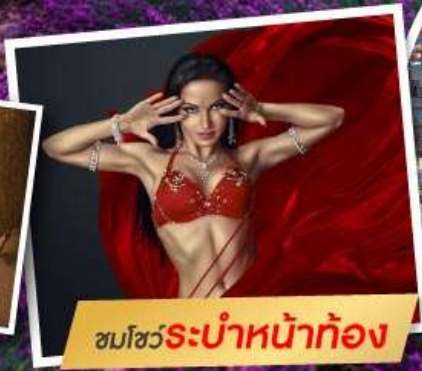
ชมโชว์ระบำหน้าท้อง