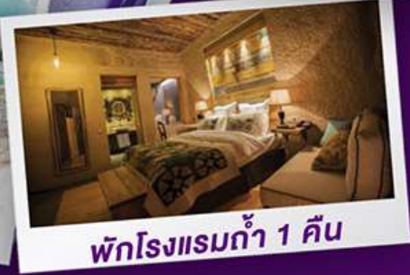
พักโรงแรมถ้า 1 คืน