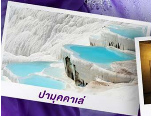
ปามุคคาเล่