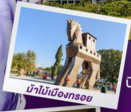
ม้าไม้เมืองทรอย