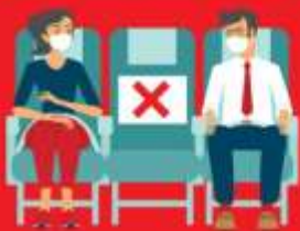
สายการบิน