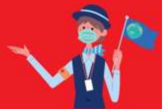
ไกด์ใส่แมสตลอดเวลา