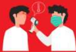
วัดไข้ผู้เดินทาง