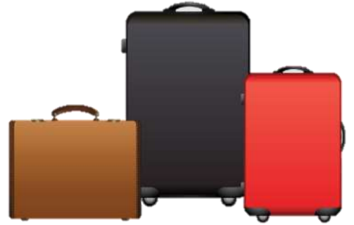
น้ำหนักกระเป๋า 20 กิโลกรัมต่อ

** เนื่องจากเป็นตัวกรุ๊ป จึงไม่สามารถริเคเวสมนอาหารได้ **