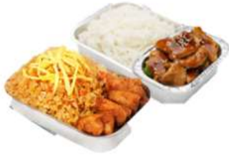
บริการอาหารร้อน ไป-กลับ บนเครื่อง

** เนื่องจากเป็นตัวกรุ๊ป จึงไม่สามารถริเคเวสมนอาหารได้ **