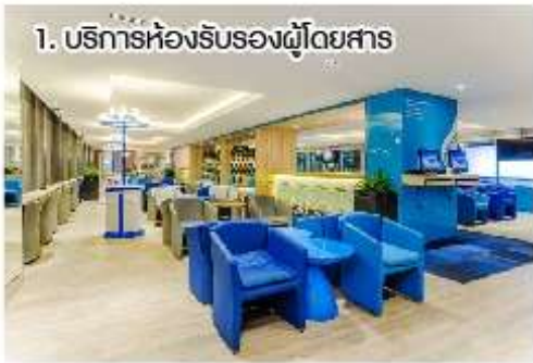
1. บริการห้องรับรองผู้โดยสาร