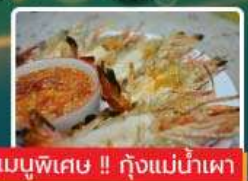
เมนูพิเศษ !! กุ้งแม่น้ำเผา

ร่วมพิธีล้างพระพิภตรัส พระมหามัญมณี (1 ใน 5 มหาบุษบาสถานอันศักดิ์สิทธิ์ของพม่า) ตักบาตรพระ กว่า 1,000 รูป วัดมหากันดา漾ค์ ล่องเรือแม่น้ำอิระวดี สู่ เมืองมิ่งกุน นั่งรถม้าเที่ยวเมืองอังวะ ชมวิว 360 องศา