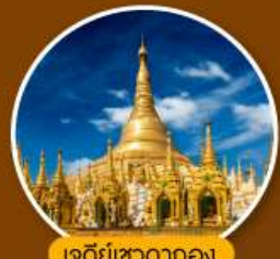
เจดีย์เขาดากอง