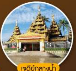
เจดีย์กลางน้ำ