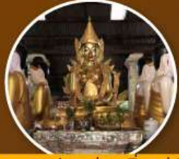
พระพุทธรูปม่านอ่อนหมั่นสะจำขึ้น