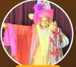
เทพทันใจ โจ๊ะซ่า