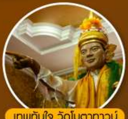
เทพทันใจ วัดโบตาทาวน์