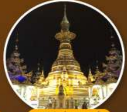
เจดีย์เอ็งดอหย่า