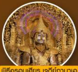
พิธีครอบเศียร เจดีย์กาบาอ