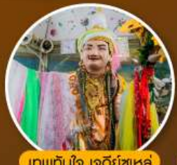
เทพทันใจ เจดีย์ซูหละ