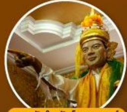
เทพทันใจ วัดโบตาทาวน์