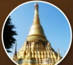
เจดีย์จิกะส่าบ