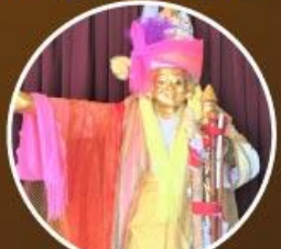
เทพทันใจ จิโซ่า