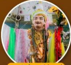
เทพทันใจ เจดีย์ซูเหล่