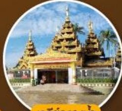
เจดีย์กลางน้ำ