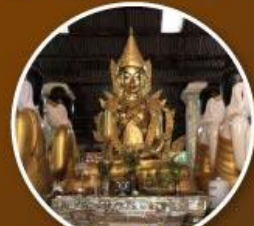
พระพุทธรูปมานอ่องหมินสะจ่าซัน