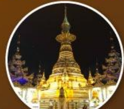
เจดีย์เอ่งดอหย่า