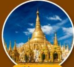
เจดีย์ชเวดากอง