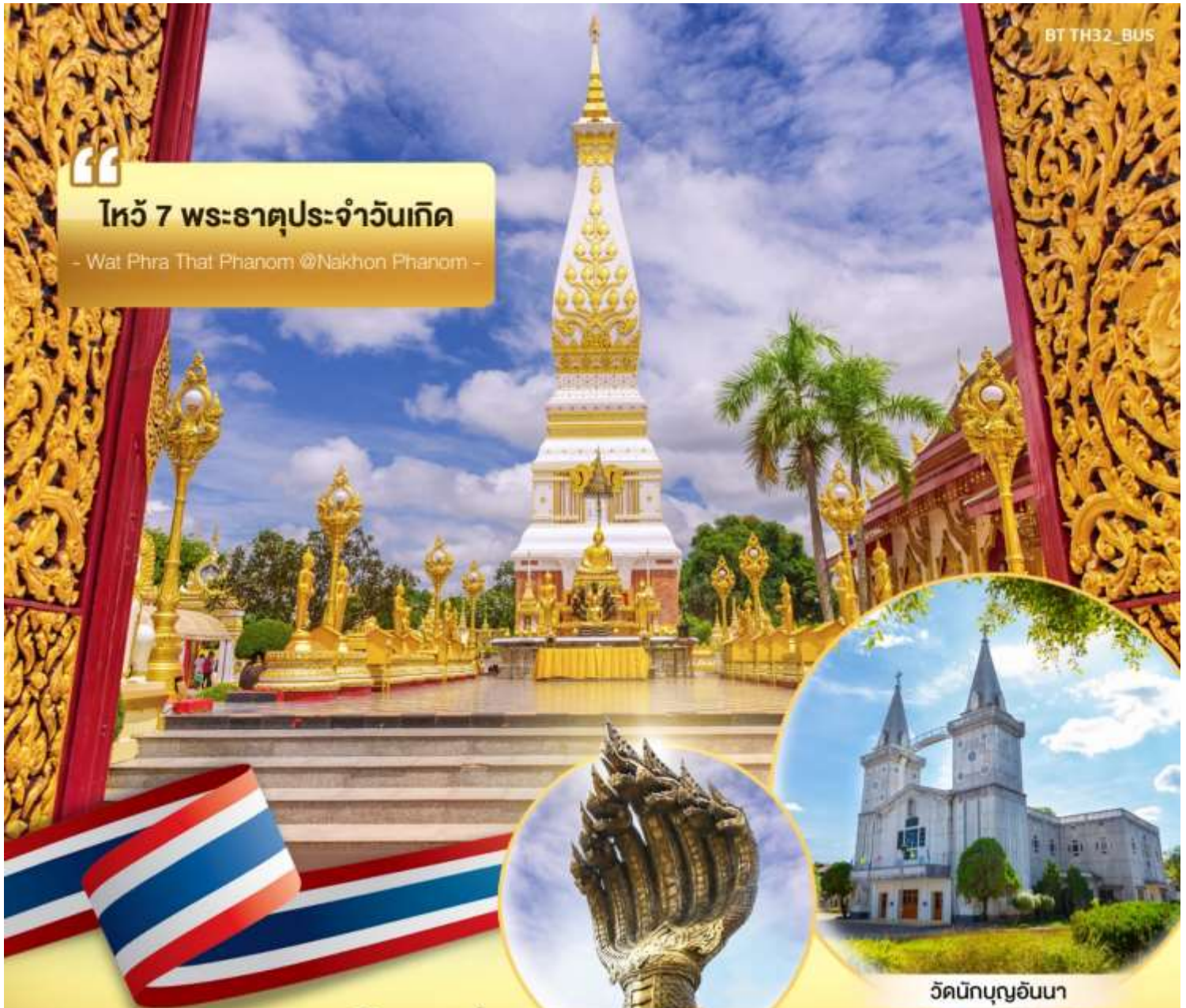
พญาศรีสัตตนาคราช