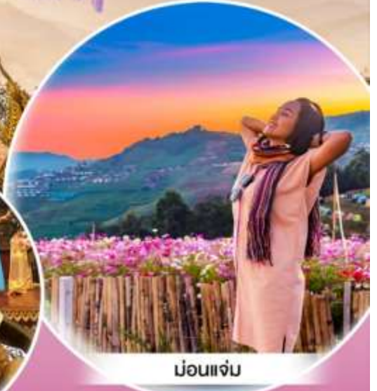
ม่อนแจ่ม

มหัศจรรย์ เชียงใหม่ ดอยคำ · แม่ริม · ลำปาง