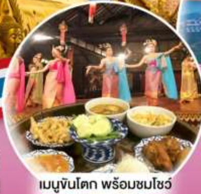
เมนูขันโตก พร้อมชมโชว์

“ ยลความงามเมืองเหนือ - Doi Suthep @Chiang Mai -