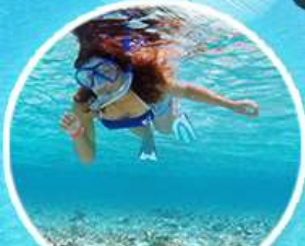
Sand Bank ชมทุดทรายขาว ดำน้ำชมปะการัง

แพ็คเกจมัลดีฟส์สุดคุ้ม บินทรู 5 ดาว ราคาเบาๆ ขนหนัก พักเกาะฮูลุมาล่ 3 คืน อาหารครบทุกมื้อ