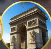
Are de Triomphe