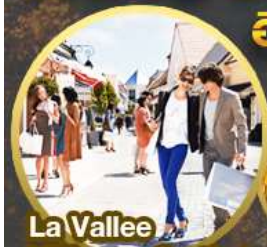
La Vallee Village Outlet