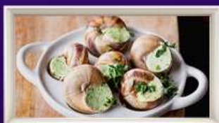
หอยเอสคาโก