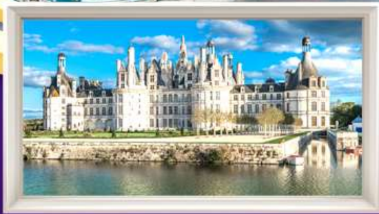
พระราชวังช็องบอร์