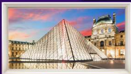
พิพิธภัณฑ์ลูฟวร์