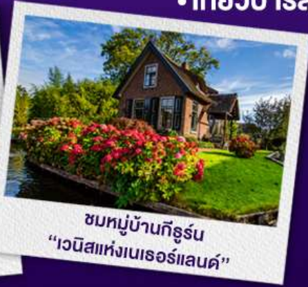
ชมหมู่บ้านทิวิร์น "เวนิสแห่งเนเธอร์แลนด์"