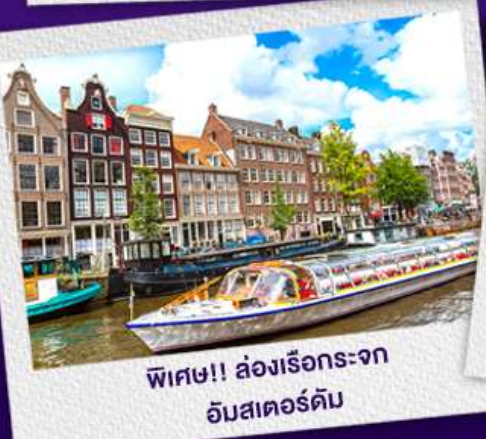
พิเศษ!! ส่งเรือระจก อัมสเตอร์ดัม