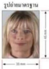
ความยาวต่ำสุดของรูปถ่าย