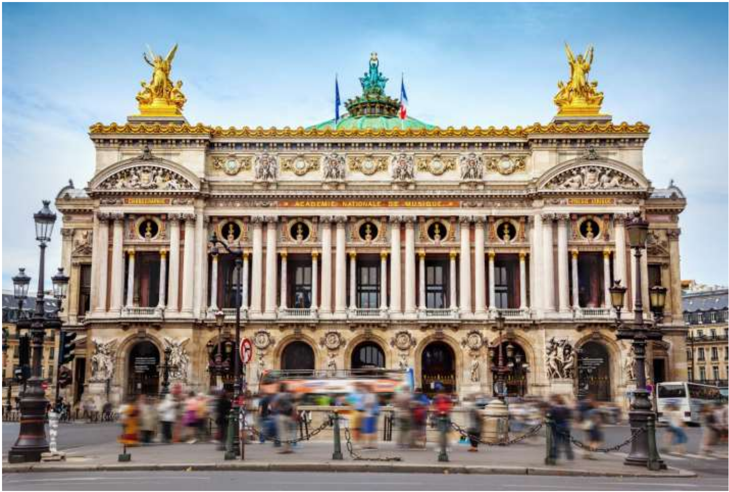
วันที่สาม เมืองปารีส - ศูนย์รวมสินค้าแบรนด์เนมปลอดภาษี กลานเดอะครี - พระราชวังแวร์ซายส์ - เมืองดีมง (B/L/D)

** อิสระอาหารกลางวัน และ ค่า เพื่อสะดวกแก่การเดินทางท่องเที่ยว โดยมีหัวหน้าทัวร์ให้คำแนะนำ ** ✈ นำคณะเข้าสู่ที่พัก Ibis Styles Paris Bercy, Paris, France หรือเทียบเท่า