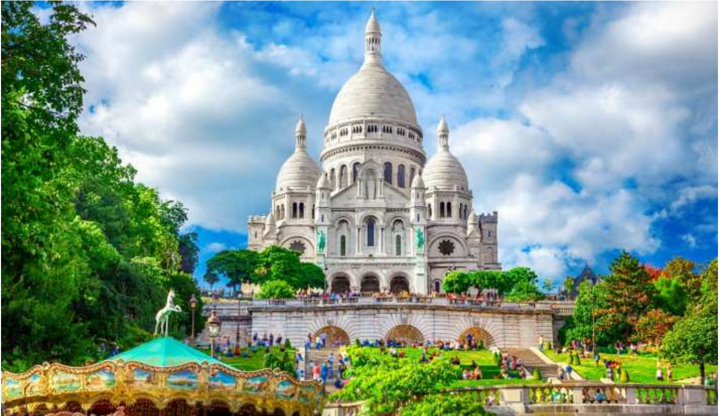
วันที่สาม เมืองปารีส - พระราชวังแวร์ซายส์ - ลาวัลลี วิลเลจ เอาท์เล็ต - เมืองดีมง (B/-/D)

☞ นำคณะเข้าสู่ที่พัก Ibis Paris Porte de Bercy, Paris, France หรือเทียบเท่า