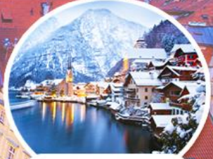
ฮัลล์สตีทท์

สัมผัสบรรยากาศช่วงเวลาคริสต์มาสของยุโรปตะวันออก เช็ก ออสเตรีย ฮังการี