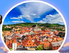
เชสกี ครุมลอฟ

เที่ยวครบทุกไฮไลต์เมืองมรดกโลก... เที่ยวชมตลาดคริสต์มาส 1 ปี มีครั้งเดียวเท่านั้น