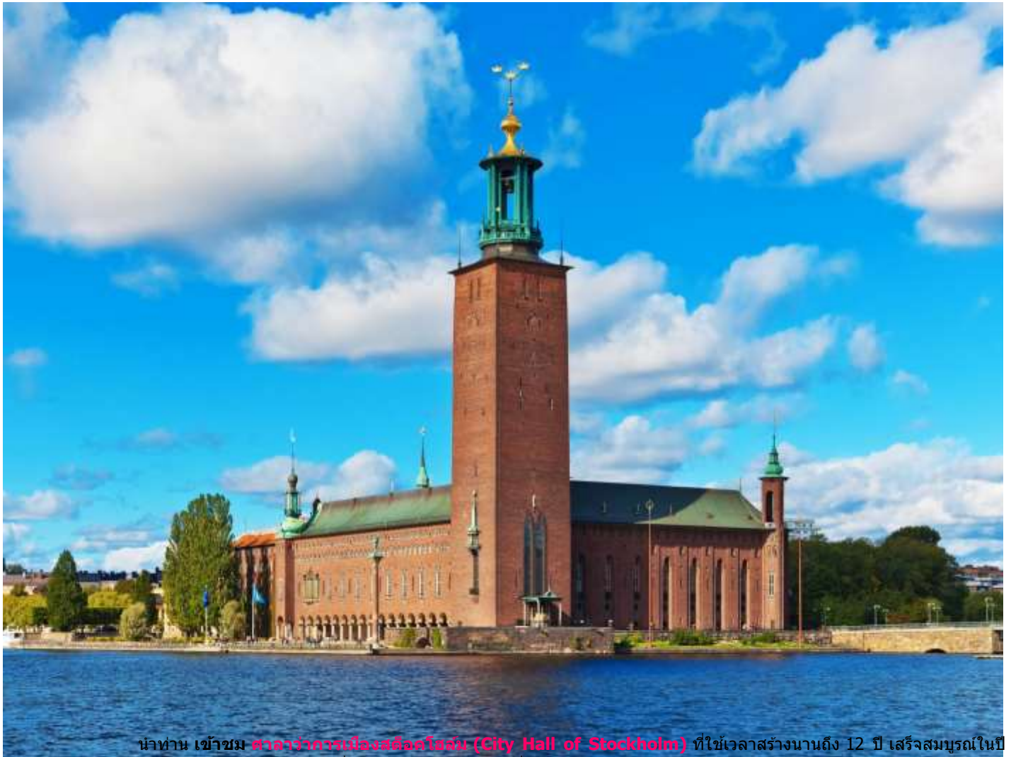
นำท่าน เข้าชม ศาลาว่าการเมืองสต็อกโฮล์ม (City Hall of Stockholm) ที่ใช้เวลาสร้างนานถึง 12 ปี เสร็จสมบูรณ์ในปี 1923 ออกแบบโดยสถาปนิกชื่อดังของประเทศสวีเดน ชื่อ เรกนาร์ ออสต์เบิร์ก (Ragnar Ostberg) สร้างด้วยอิฐแดงกว่า 8 ล้าน

กลางวัน บริการอาหารกลางวัน ณ ภัตตาคาร (อาหารจีน)