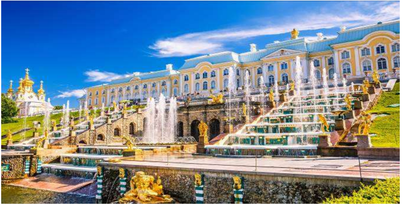
Peterhof ปิด ทางทัวร์จะจัดหาสถานที่ท่องเที่ยวอื่นทดแทน กรุณาตรวจสอบกับหัวหน้าทัวร์อีกครั้ง)