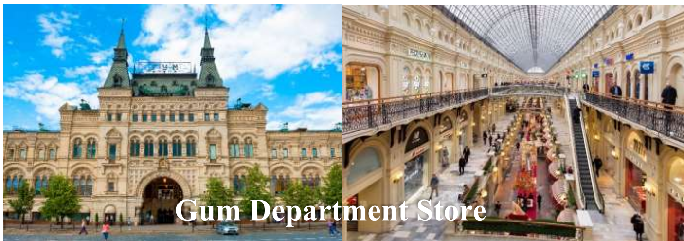
GUM Department Store

นำท่านเดินทางสู่ ถนนอาร์บัต (Arbat Street) เป็นถนนคนเดินยาวประมาณ 1 ก.ม. เป็นทั้งย่านการค้า แหล่งรวมวัยรุ่น ร้านค้าของที่ระลึก ร้านนั่งเล่น และยังมีศิลปินมานั่งวาดรูปเหมือน รูปล้อเลียน และศิลปินเล่นดนตรีเปิดหมวกอีกด้วย ถือว่าเป็นถนนคนเดินที่ใหญ่ที่สุดในเมืองมอสโกเลยทีเดียว