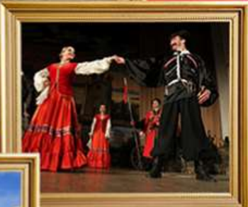
ชมการแสดง Folk Show