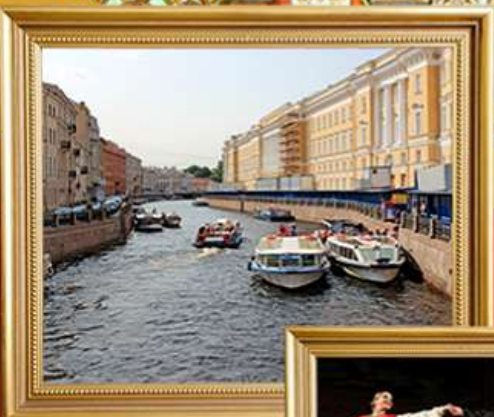
ล่องเรือแม่น้ำ NEVA ฉลองฤดูหนาว white night