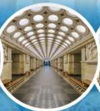
สถานีไฟใต้ดิน กรุงมอสโก