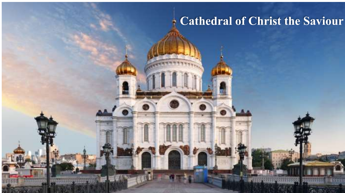
Cathedral of Christ the Saviour

นำท่านเดินทางสู่ สถานีรถไฟใต้ดินเมืองมอสโกว์ (Moscow Metro) ถือได้ว่าเป็นความสวยงามมากที่สุดในโลก ด้วยความโดดเด่นทางสถาปัตยกรรมการตกแต่งภายในสถานี ความสวยงามของสถานีรถไฟฟ้าใต้ดินมีจุดเริ่มต้นมาจากช่วงแรกสุดที่สถานี ขึ้นมาเป็นผู้นำสหภาพโซเวียต ลักษณะของสถาปัตยกรรมที่นำมาตกแต่งภายในสถานีนั้นเป็นลักษณะของงานศิลปะที่สร้างขึ้นเพื่อระลึกถึงคุณความดีของวีรบุรุษ (Monumental Art) ซึ่งจะสื่อออกมาในรูปของงานปั้น รูปหล่อ ภาพสลักนูนต่ำ ภาพวาดประดับลวดลายแบบโมเสก