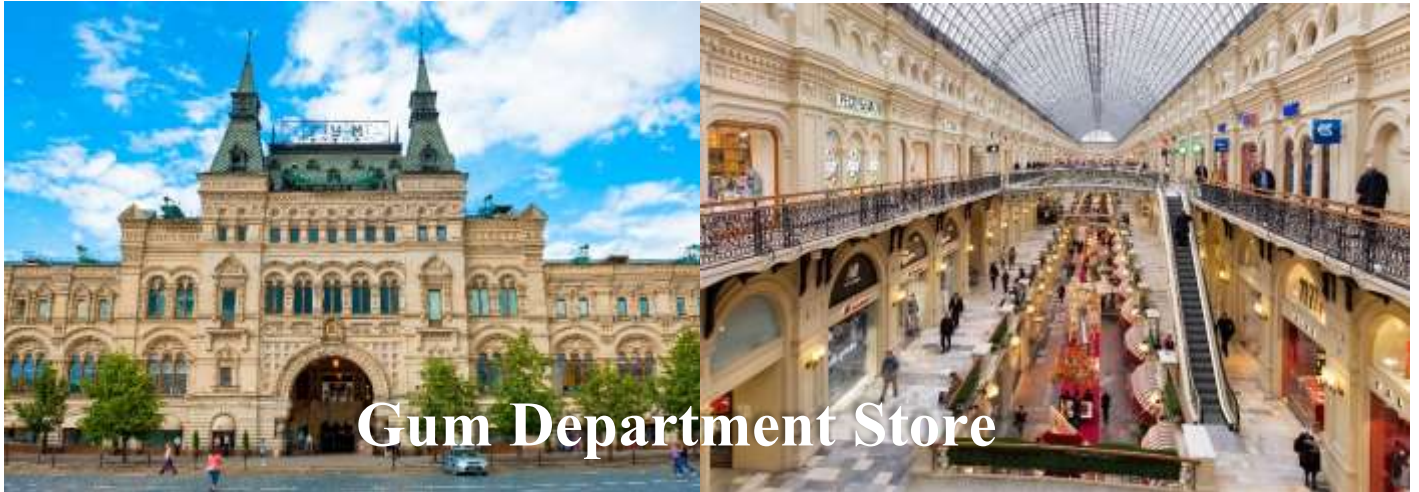
GUM Department Store

นำท่านเดินทางสู่ ถนนอาร์บัต (Arbat Street) เป็นถนนคนเดินยาวประมาณ 1 ก.ม. เป็นทั้งย่านการค้า แหล่งรวมวัยรุ่น ร้านค้าของที่ระลึก ร้านนั่งเล่น และยังมีศิลปินมานั่งวาดรูปเหมือน รูปล้อเลียน และศิลปินเล่นดนตรีเปิดหมวกอีกด้วย ถือว่าเป็นถนนคนเดินที่ใหญ่ที่สุดในเมืองมอสโกเลยทีเดียว