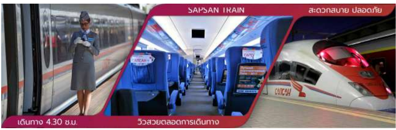
เดินทาง 4.30 ชม. วิสวเขตตลอดการเดินทาง

จากมอสโก-สู่เช็นตีปีเตอร์สเบิร์ก (ตารางเดินรถอาจมีการเปลี่ยนแปลง กรุณาตรวจสอบกับเจ้าหน้าที่หรือหัวหน้าทัวร์อีกครั้ง)