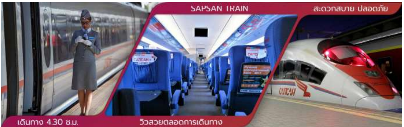
เดินทาง 4.30 ชม.

..... น. ออกเดินทางโดยรถไฟด่วน SAPSAN EXPRESS TRAIN จากเซนต์ปีเตอร์สเบิร์ก - สุ่มอสโก