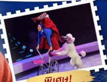
พิเศษ! ชมโชว์ ละครีส์ตัว

มอสโคว์ - เซนต์ปีเตอร์สเบิร์ก วิหารเซนต์บาซิล จัตุรัสแดง พระราชวังปีเตอร์ฮอฟ พระราชวังแคทเธอรีน นั่งรถไฟความเร็วสูง Sapsan