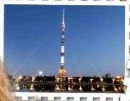
พิเศษ! ทานอาหาร ชมวิว Panorama ที่ตึก Oostankino Tower